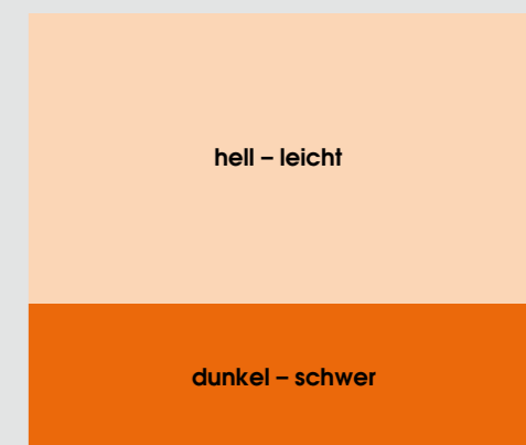
3. Statische Wirkung von Farben